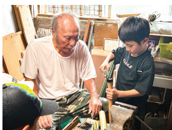
竹の水鉄砲作成・ゴムの部分をやすりがけをする様子