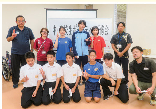
中・高校生ボランティア研修会