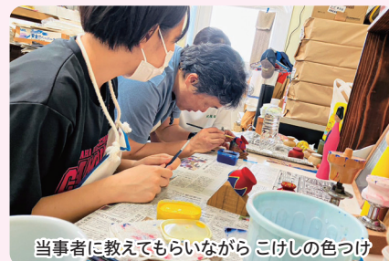
当事者に教えてもらいながら こけしの色つけ