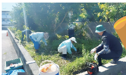
農地開拓 ～草刈り作業の様子～

「チーム YAESE」とは、ひきこもりや社会的孤立、障がい者、一人暮らしの高齢者など本会の参加型事業を通して結成した当事者によるボランティア団体です。令和7年2月に団体として結成し、4月から本格的に活動を開始しました。本会は、当団体と相互関係を築きながら地域とつながる・つなげる活動をサポートしております。