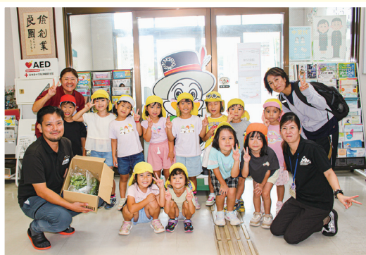
わかたけ保育園より野菜の寄贈