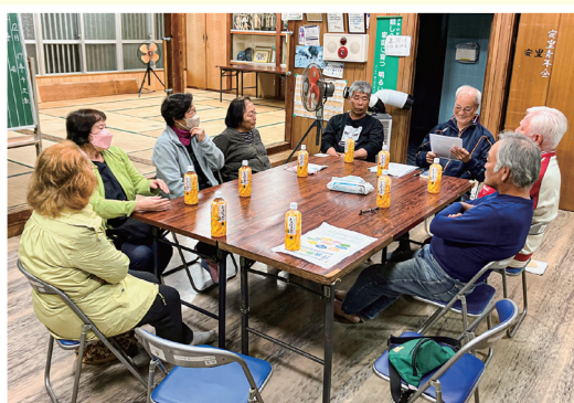
安里支え合い委員会