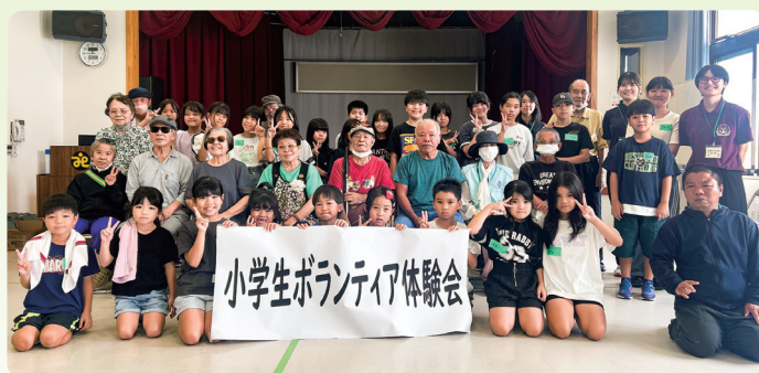
小学生ボランティア体験会

また、この日は運営のサポートとしてボランティア団体「チーム YAESE」が体験会のサポートをしてくれました!