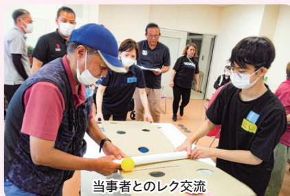
当事者とのレク交流