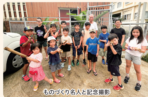
ものづくり名人と記念撮影

参加した子どもたちからは「竹の水鉄砲は初めて見た」「使い終わった島ぞうりや木の破片を再利用してすごいと思った」等の感想があり、初めて見る事が多くとても真剣な様子で学んでくれました。