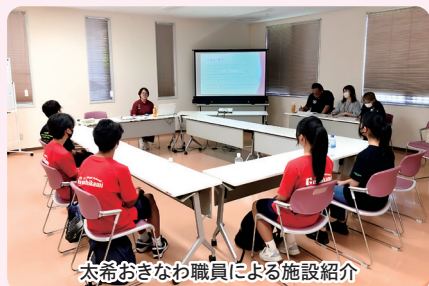
太希おきなわ職員による施設紹介

太希おきなわには施設の紹介をしてもらい、生徒たちには施設内での当事者の就労(パン班、民芸班、何でも班)の体験やレクをサポートしてもらいました。参加した生徒から「施設に初めて入った」「障害があってもできる事はたくさんある」「施設のイメージが変わった」と感想もあり、当事者理解に繋がったと思います。