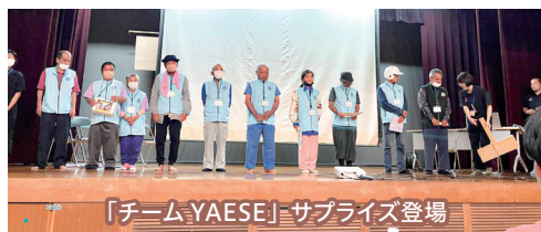
「チームYAEESE」サプライズ登場