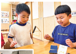
「ペタンコ」で遊ぶ子どもたち