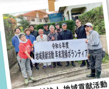
社会福祉法人 地域貢献活動