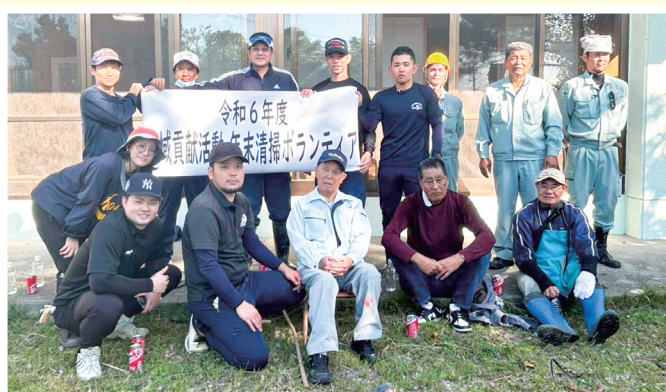
地域貢献活動 年末清掃ボランティア