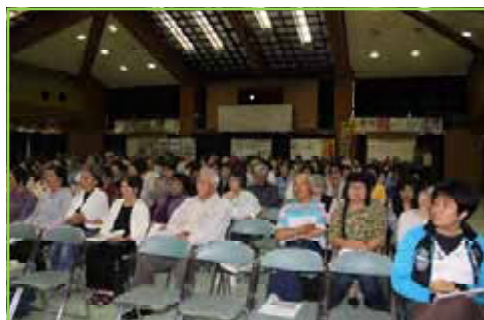
皆さん真剣に聞いています。災害時には、『自助』、『共助』が大事であり、地域での繋がりづくりが防災力向上になります。