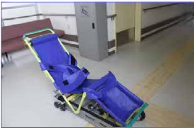
非常用階段避難器具 キャリダン (※社会福祉会館2階階段横に設置)