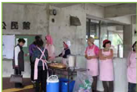
八重瀬町赤十字奉仕団による炊き出しも行われました。