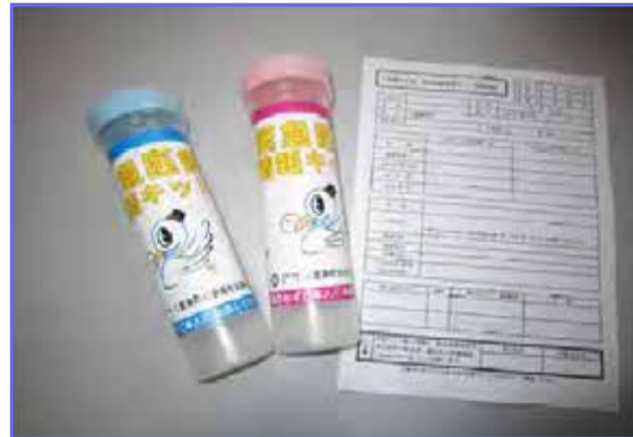
「緊急医療情報キット」作成