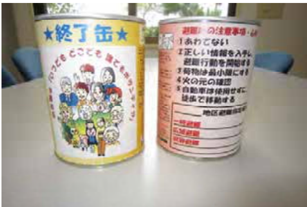
非常食用缶入りソフトパン (2回購入)