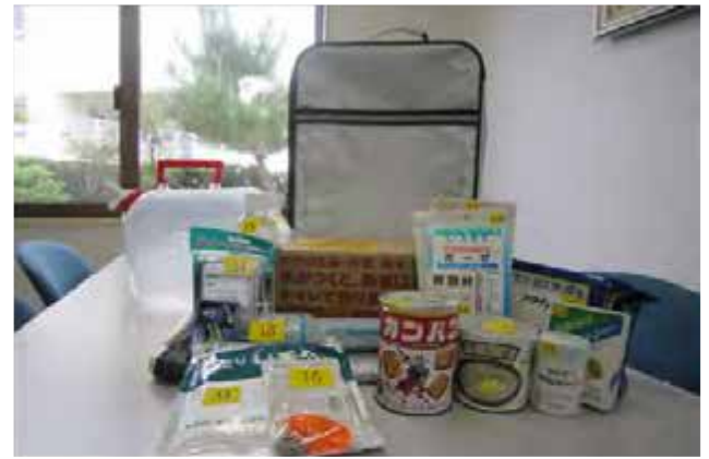
非常用持出袋セット キャスタータイプ