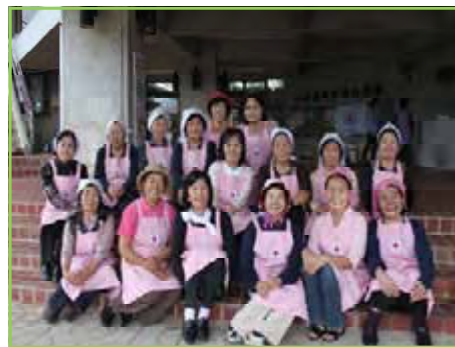
八重瀬町赤十字奉仕団のみなさん