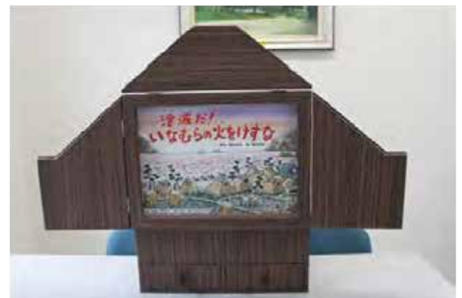
紙芝居舞台セット 「津波だ！いなむらの火をけすな」

※紙芝居は貸出しています。学校での読み聞かせや授業等で活用したいなどの要望がありましたら、八重瀬町社会福祉協議会までお問い合わせください。