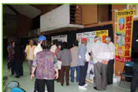
アールピーエス株式会社 非常用保存食の展示をご協力いただきました。