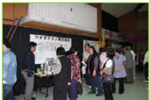
マチダテクノ株式会社 防災用品の展示をご協力いただきました。