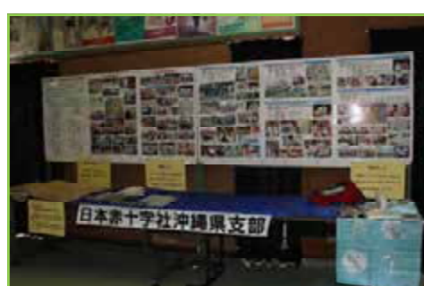
日本赤十字社沖縄県支部より、東日本大震災の写真パネル・災害時備蓄品をお借りして展示しました。