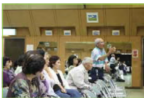
聴覚に障がいをもたれている方からの質問。災害時での要援護者の支援体制構築が改めて重要だと感じました。