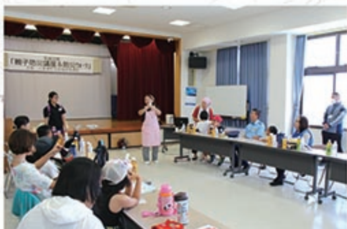
防災知識や講座の様子