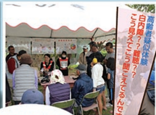
高齢者疑似体験 白内障??、難聴?? 「見えにくい」「聞こえない」を体験しよう