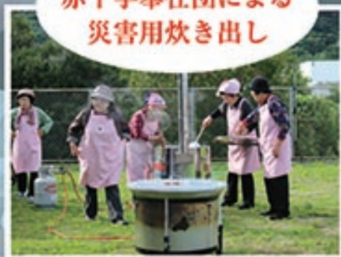
赤十字奉仕団による 災害用炊き出し

【参加者の声】 ・初めて防災訓練に家族で参加しました。地域の方となかなか顔を合わせることがないのでこの様な機会を設けてくれてありがとうございます。家庭でも改めて災害について話し合いたいと思います。非常食の体験も初めてで感動しました。 ・地域の人とも顔合わせできましたし、年1回そういうのがあればいいなと思った。 ・人工呼吸を初めて体験して良かったです。消火器の使い方も久しぶりに触ったのですが忘れていました。 ・たくさんの方の協力があっていろいろな事を学べたので良かった。