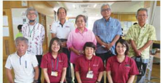
町内の区長・自治会長さんと東風平地区担当CSW（コミュニティソーシャルワーカー）、社協防災担当も協力させていただきました。