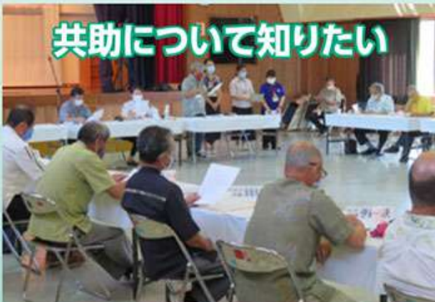
地域ではどのような備えをしていますか？ 区長・自治会長会へインタビューの協力を依頼。