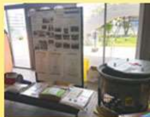
奉仕団活動の様子