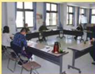
協力団体との調整