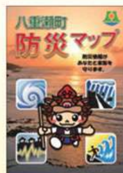
八重瀬町防災マップ