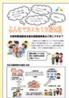
災害時要援護者 支援台帳