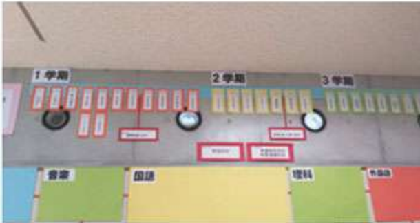
1年を通して「防災」の計画をたててスタート

目的： 八重瀬町の人々の安心な暮らしを支える防災の充実を目指した活動を通して、自らを守ること（自助）はもちろん、他者と協力し合っ自分たちを守ること（共助）の大切さを理解し、持続可能な八重瀬町の防災の在り方について考えるとともに、自らの生活や行動に生かすことができるようにする。