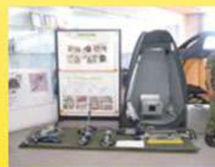
救助機材と簡易トイレ