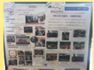
日本赤十字社救護班の活動記録