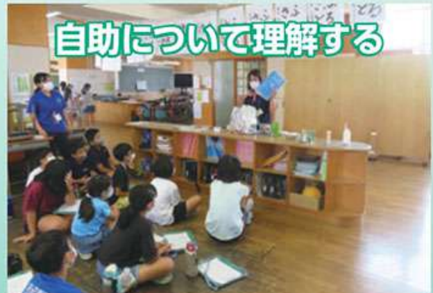
非常持ち出し袋はどうして準備する必要があるの？ どんなものを準備すると良いの？準備物の講話。