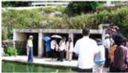
民協危険箇所点検