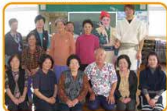
上田原ミニデイ交流会