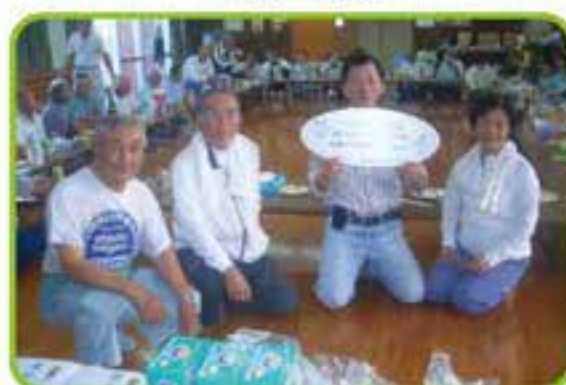
グラウンドゴルフ交流会「富盛」