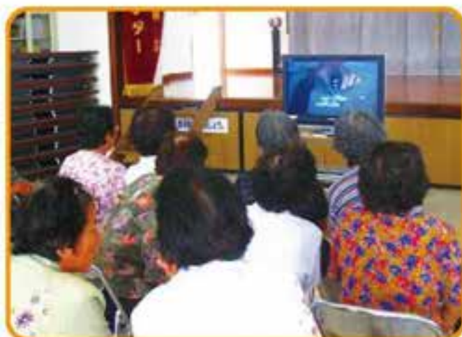
具志頭地区 DVD 鑑賞