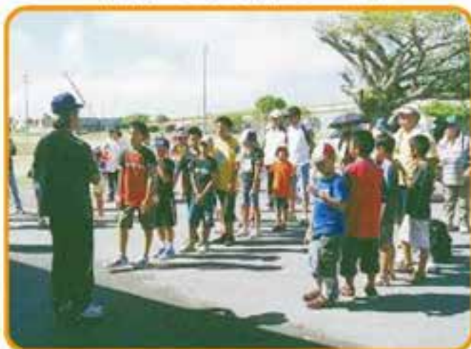
具・港・長・長田子ども会 PG 交流会