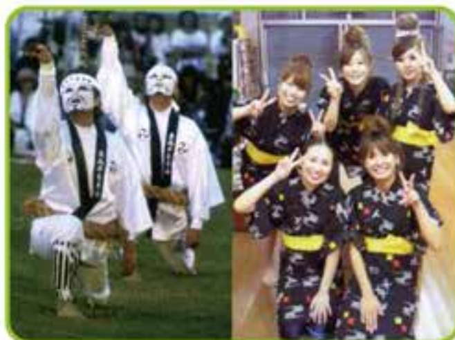
東風平青年会助成事業