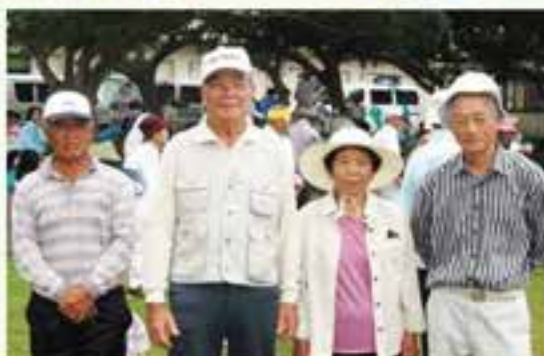
南老運主催ベタンク大会で優勝した破名城チーム