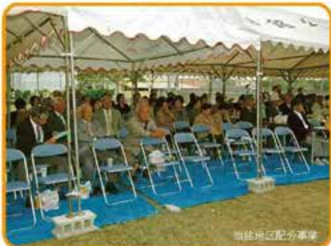
当銘地区配分事業