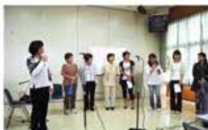
音訳サークル活動