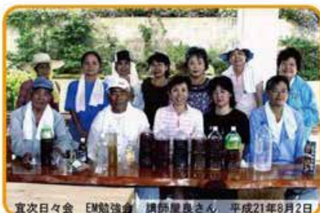
宜次日々会 EM勉強会 講師星良さん 平成21年8月2日