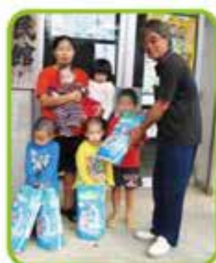
出産おめでとう「世名城」