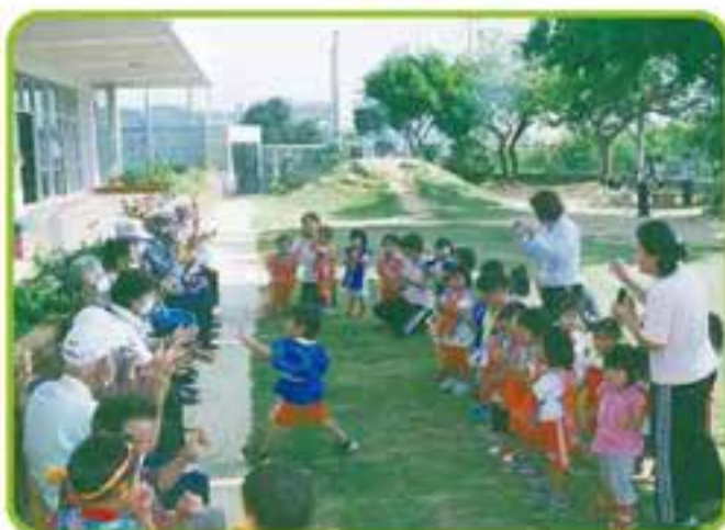
港川保育園と長毛団地老人クラブとの交流会