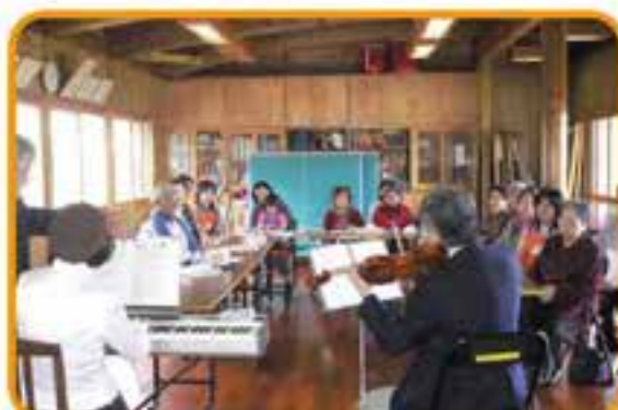
友寄東ハイツミニコンサート