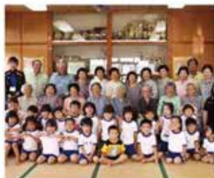
園児と高齢者交流