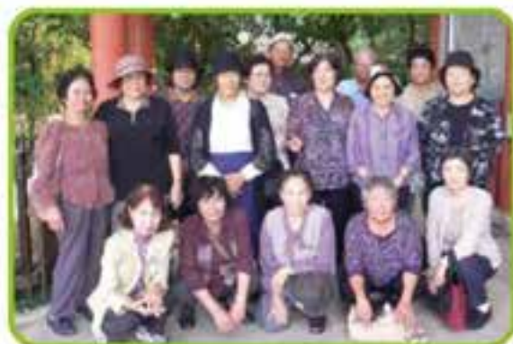
屋宜原ミニデイピクニック