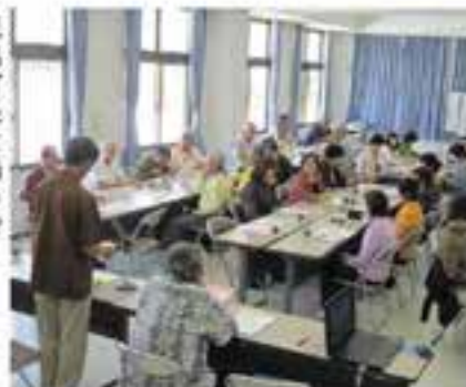
民協町長と語る会