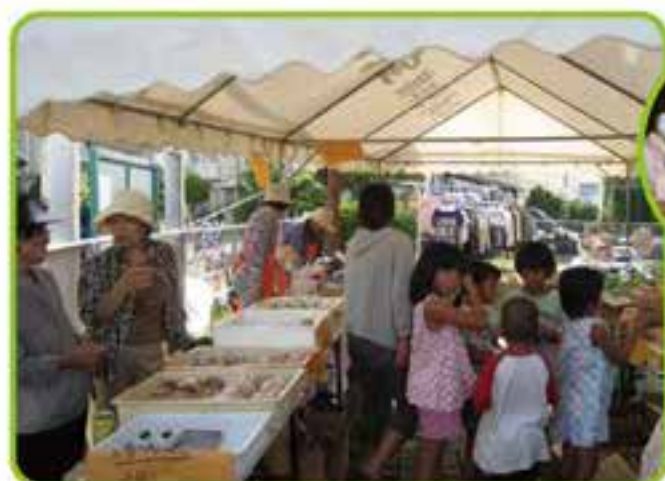
友寄東ハイツわくわくりサイクルバザー