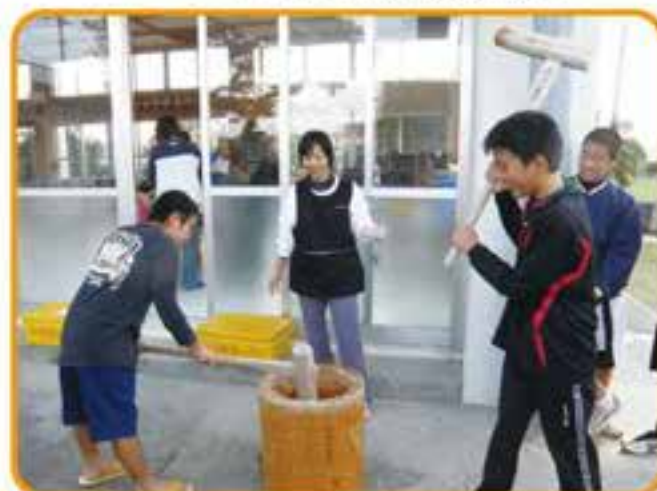
新春もちつき交流会「後原」