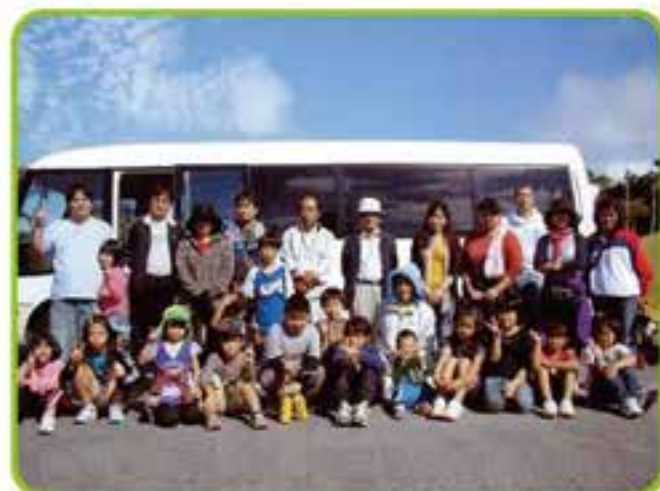
子どもシーヤーマーバスツアー「新城」