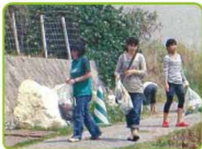
港川子ども会と高齢者のボランティア活動(ゴミ拾い)