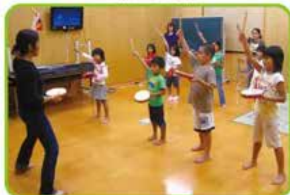
屋宜原子ども会エイサー練習の支援