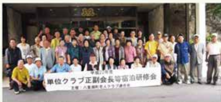
町老運主催単位老人クラブ正副会長等宿泊研修会