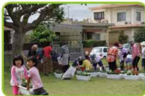
花いっぱい花ハナ交流会