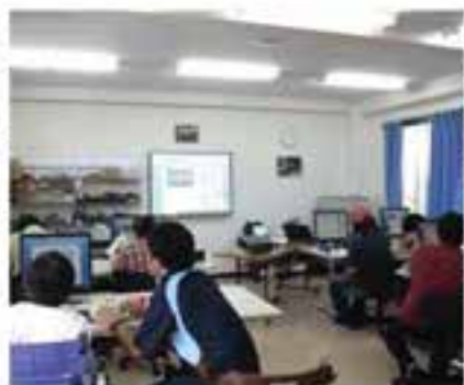
障がい者パソコン教室