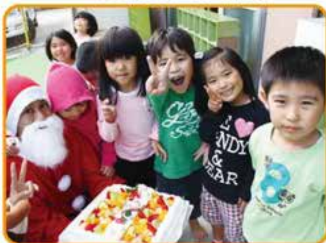
クリスマスケーキ配分事業