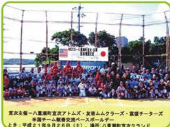
宜次主催一八重瀬町宜次アトムズ・友寄ムムクラブズ・富盛チーターズ 米国チーム観戦交流ベースボールデー とき：平成21年9月26日(土)、場所：八重瀬町宜次グラウンド