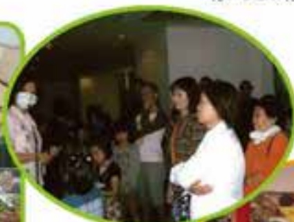
外間高層住宅 交流ピクニック