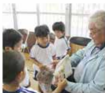
園児との交流会(飛行機づくり)