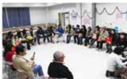
手話交流会で楽しく学ぶ