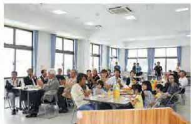
初めての町民関係者との交流