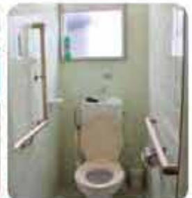
屋宜原団地トイレ手摺設置