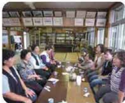
世名城配食ボランティア連絡会(4/27)