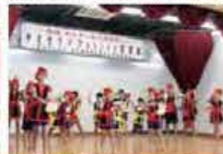
屋宜原子ども会エイサー