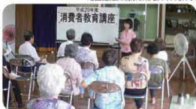
熱心に耳を傾ける長毛の皆さん