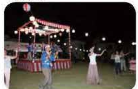
四つ竹購入事業 ( 東ハイツ祭り)