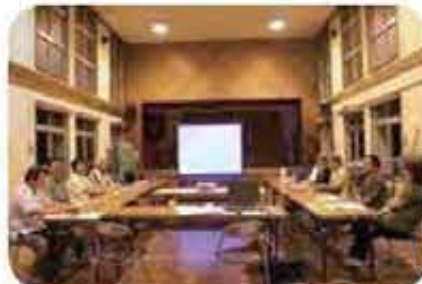
友寄地域福祉懇談会 (6/14)