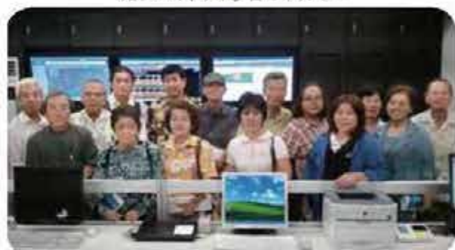
地区推進員視察研修会(沖縄科学技術大学院大学の防災センターにて)