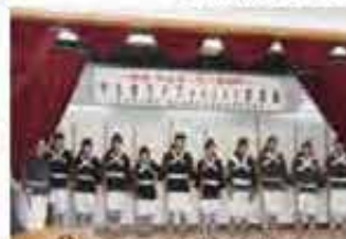
宇東風平棒術保存会