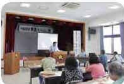
第 1 回群星鼓 (9/14)