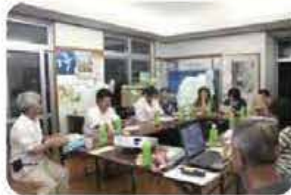
外間高層住宅地域福祉懇談会 (5/9)