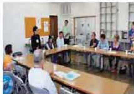
皆で集う楽しさよ