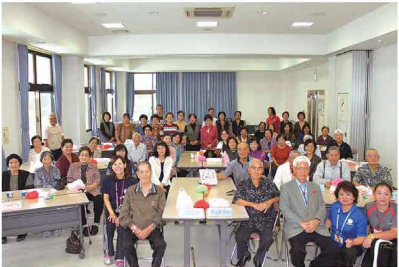
「配食サービス利用者の集い」参加者の皆さん