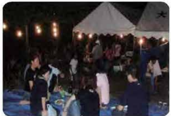
団地住民のいこいの夕涼み会(大頓団地)