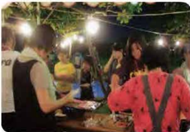
バーベキューで食事会交流(大頓団地)