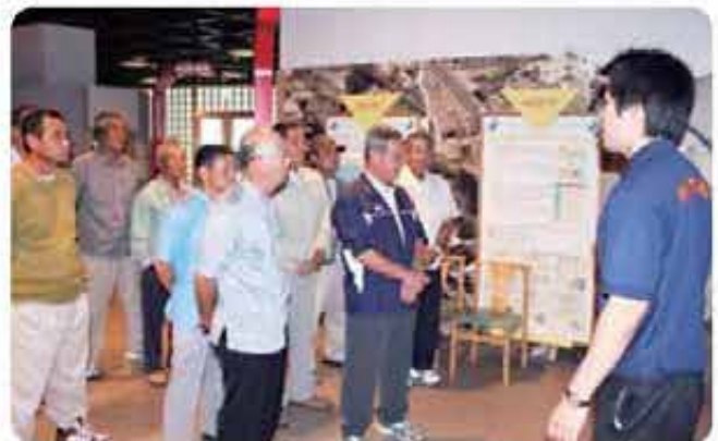
西地区推進員視察研修会（沖縄市防災センター）