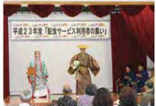
舞台は若手芸能有志の協力で大盛況

※社協では、町より在宅サービス事業の受託事業として、今後も高齢者等の食の自立に繋がられるよう支援していきます。