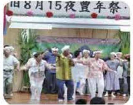
高良十五夜祭及び敬老会