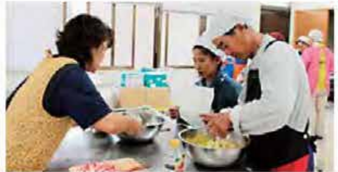
カボチャのサラダは栄養満点よ!