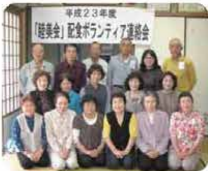
富盛配食ボランティア連絡会(4/13)