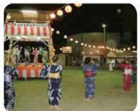
後原第40回盆踊り大会(8/20)