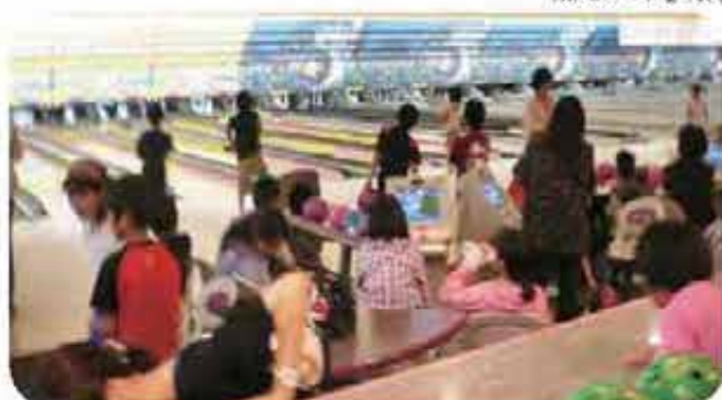
親子、友だちとの交流を図る長毛団地の子ども会の皆さん