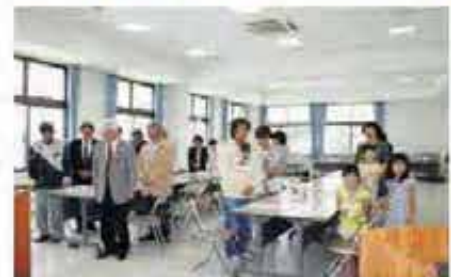
大震災犠牲者の冥福を祈り 全員で黙とう

東日本大震災で八重瀬町内に避難されている家族と町民とのつながりを深めることを目的とした「やえせライフ enjoy 交流会」(主催:八重瀬町社会福祉協議会)が11月20日に八重瀬町社会福祉会館で開催されました。