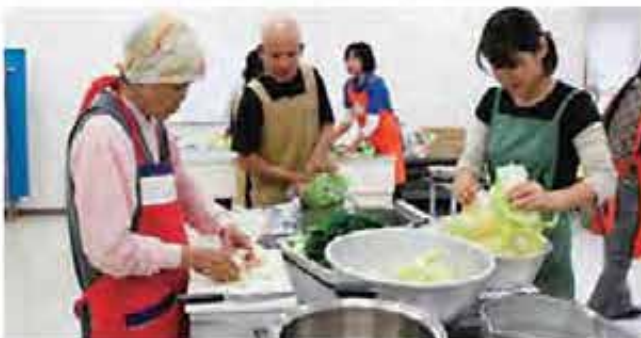
取れたての野菜で元気もり盛り!