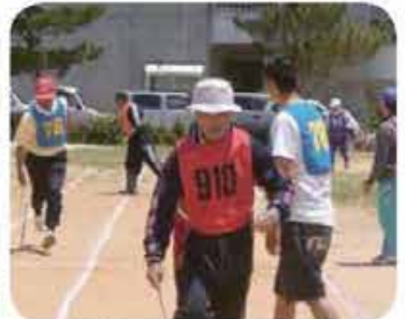
後原第33回区民運動会(4/24)