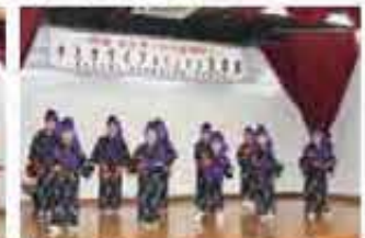
新城子どもシーヤーマーククラブ