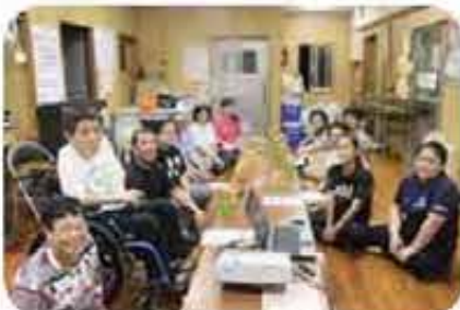
県営屋宜原団地地域福祉懇談会 (5/20)