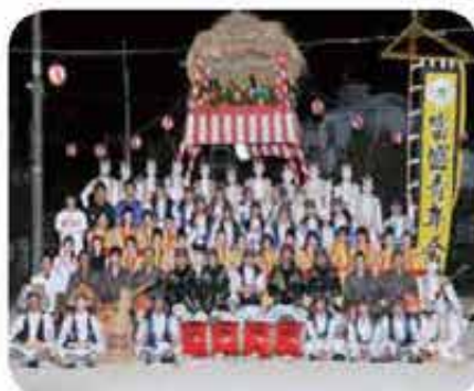
富盛青年会エイサー(5/7~8/31)