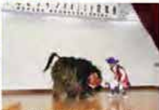
玻名城子ども獅子舞