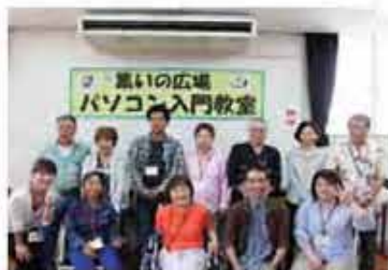
開講式 平成23年5月19日)

また、作品展などの芸術・文化活動の発表の場を設けるとともに、発表の場の情報提供を行い、障がい者の創作意欲の助長を図ることを目的とした事業です。1月～3月までの間、「書道教室」も予定されています。(お問い合わせ先:八重瀬町社会福祉協議会 電話998-4000まで)