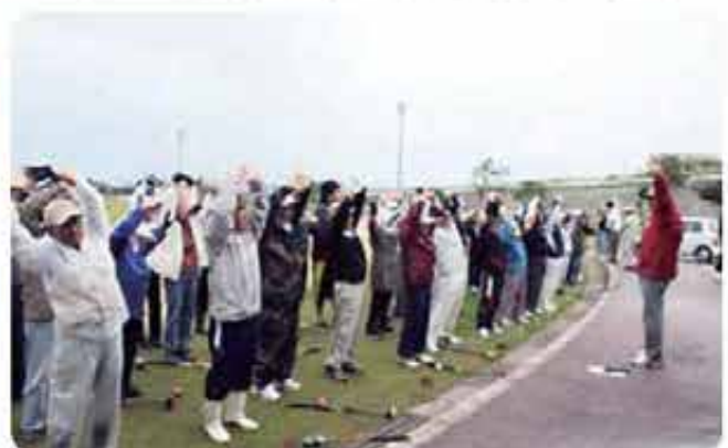
オイッチニ！区民そろって準備体操！ （字具志頭パークゴルフ大会：具港長長団地区）