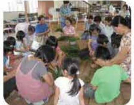
高良おじー・おばーと昔の玩具づくり(8/24)