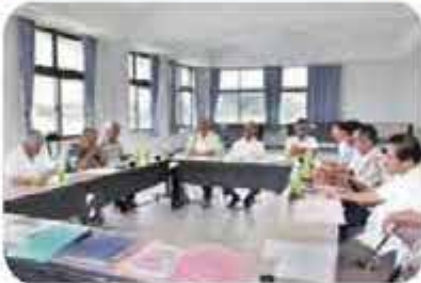
第 1 回地区推進会 (4/28) 第 2 回 (7/28)