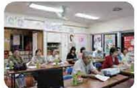
県営外間団地地域福祉懇談会 (6/8)