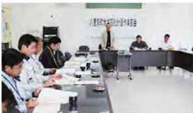
第 1 回八重瀬町地域福祉計画作業部会( 12/6 )