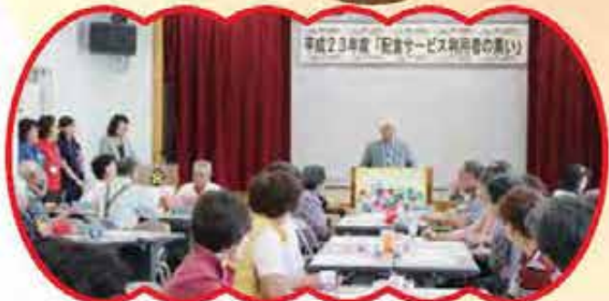
激励のあいさつをする神谷社協会長