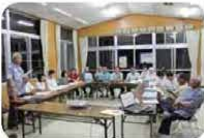
大倉ハイツ地域福祉懇談会 (6/4)