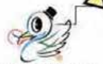
福祉の心を運ぶ鳥『クックル』 八重瀬町社会福祉協議会イメージキャラクター