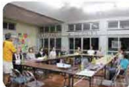
白川ハイツ地域福祉懇談会 (7/9)