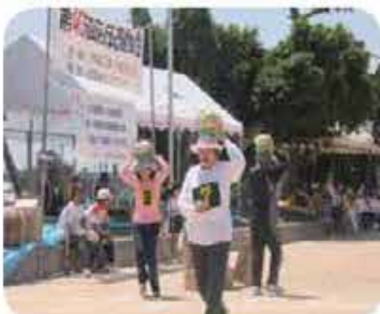
世名城第47回区民運動会(4/24)