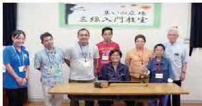
三味線教室開講式 平成23年10月5日)