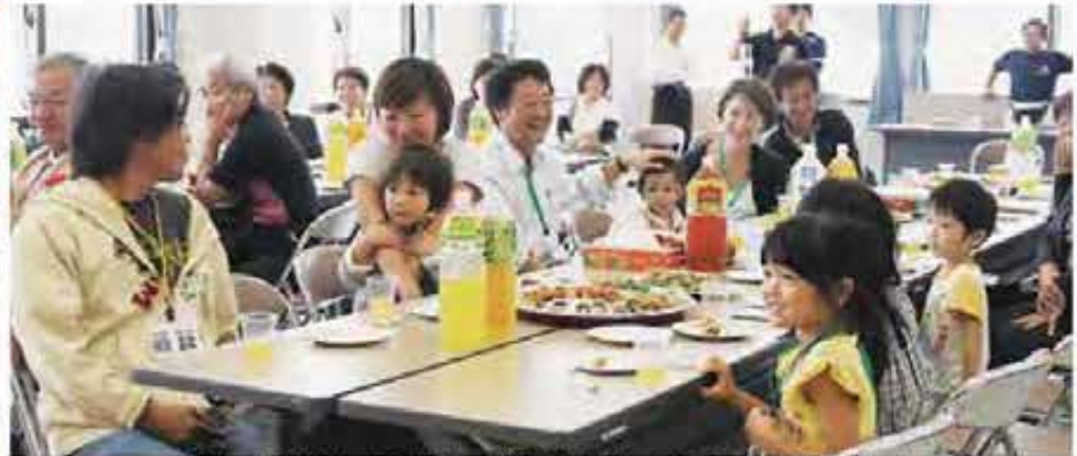
突然、舞台から舞い降りた獅子に驚くやら喜ぶやらの皆さん