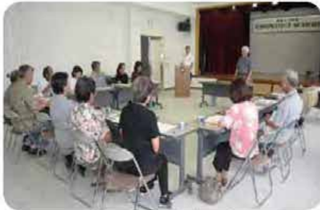
第1回地区推進会議(5/25)