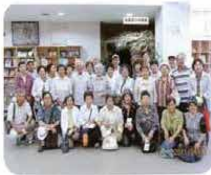
富盛高齢者の文化財めぐり(6/17)