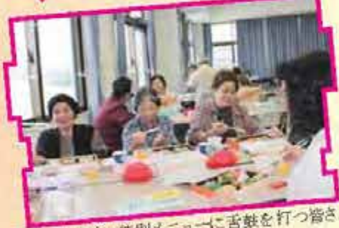
「おいしいね」特別メニューに舌鼓を打つ皆さん