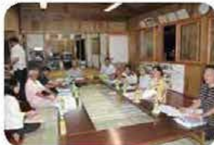
友寄東ハイツ地域福祉懇談会 (6/5)