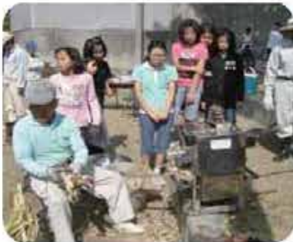
後原親子ふれ合い黒糖づくり(4/10)