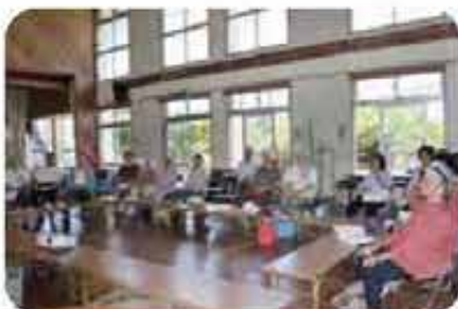
友寄( 星の部) 地域福祉懇談会 (6/14)