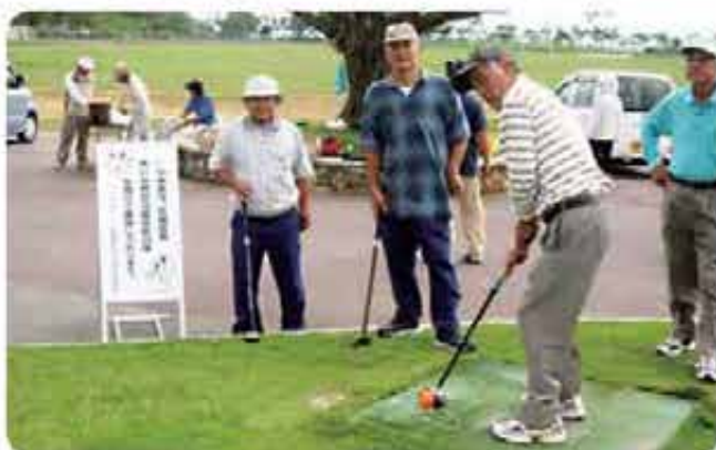
めざせ！ホールインワン！ （富盛高齢者チャーガンジュウパークゴルフ大会：志風地区）