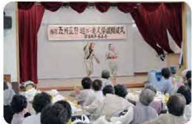
東風平(長寿会)旧暦5月5日遊び(6/6)