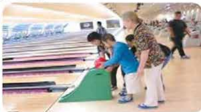
安心してボウリングが楽しめるね