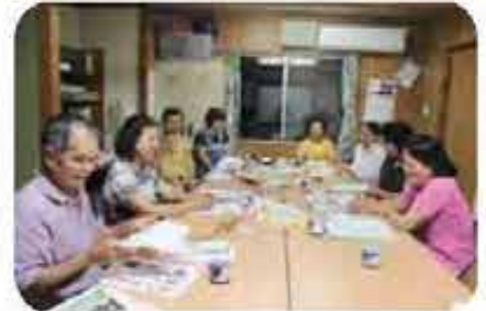
第一団地地域福祉懇談会 (5/10)