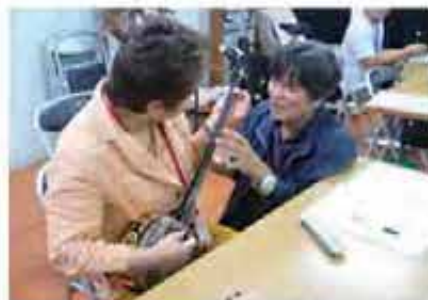
集いの広場 障がい者三線教室 H23.10.5～12.2)