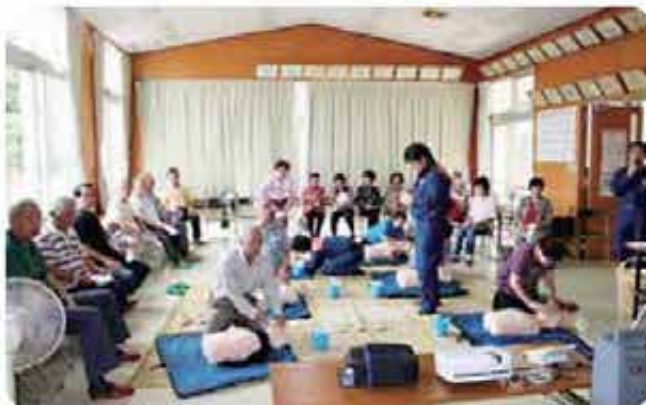
群星地区応急手当講習会（第2回群星塾）