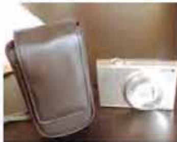
地区子育て支援事業 (助成金交付事業) デジタルカメラの購入事業 (わかば児童クラブ)