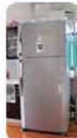
第一団地冷蔵 庫購入事業