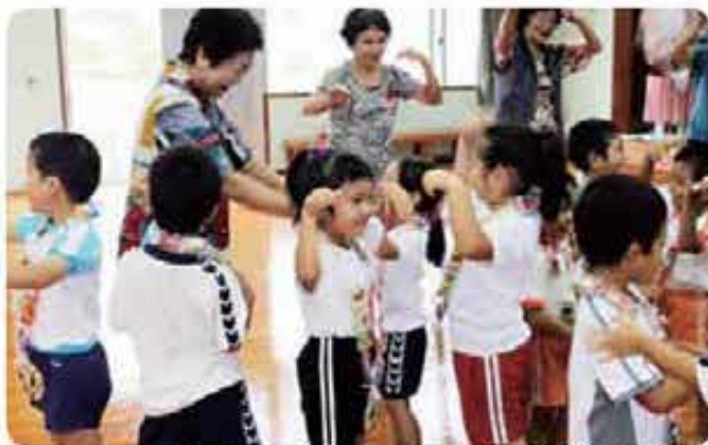
カチャーシーって楽しい！（富盛高齢者とみなみ保育所園児との交流会：志風地区）