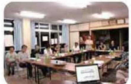
屋宜原団地地域福祉懇談会 (6/3)