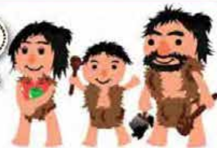
港川入ファミリー