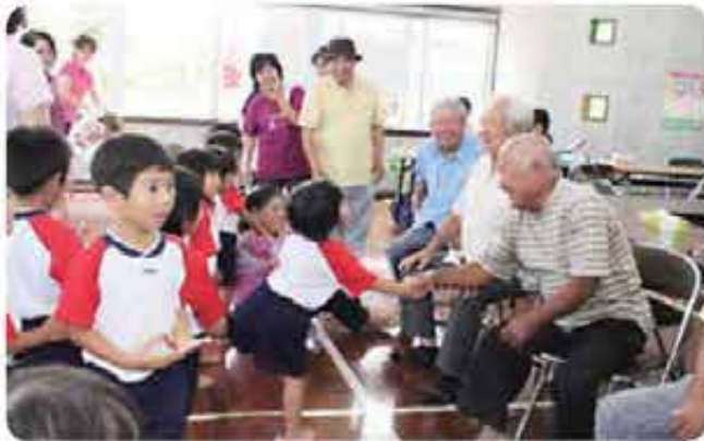
おじいちゃん、大喜び！（白川ハイツ高齢者と清ら風保育園児との交流会：群星地区）