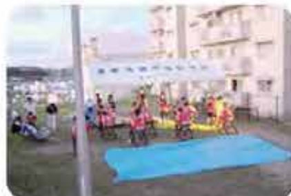
県営外間団地夕涼み会 (7/30)