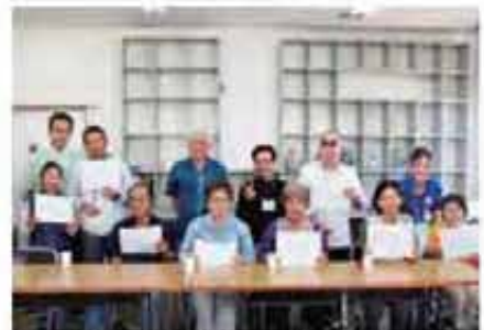
開講式及び修了証交付式 (9月29日)