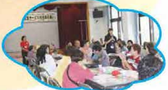
利用者とスタッフの信頼関係あればこそ!