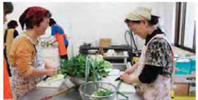
傍目の心配をよそにトントんと見事な包丁さばき