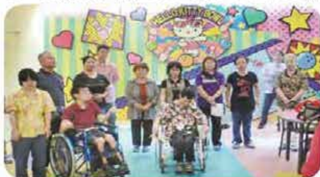
嬉しいな、今年も皆で来れて…