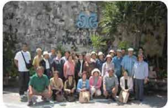
屋宜原(すみれ会)ピクニック(6/3)