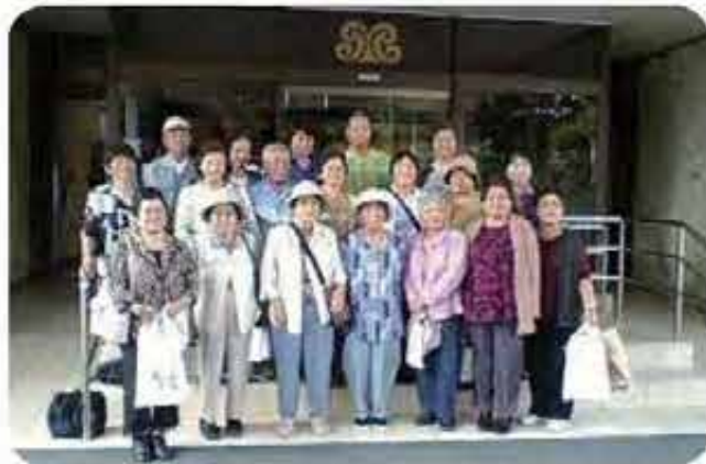
伊弉(ひまわり会)ピクニック(7/20)