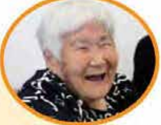
満面の笑みでありがとうございます!