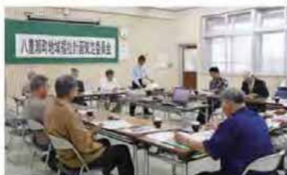
社協受託事業(事務局は社協内)の説明の様子

「地域福祉」とは、こうした生活上のさまざまな課題について、自分たちが住んでいる地域という場所を中心に考え、だれもが安心して自立した生活を送ることができるよう、ともに支えあい助けあいながら、暮らしやすいまちづくりを進めていこうとする取組みのことをいいます。