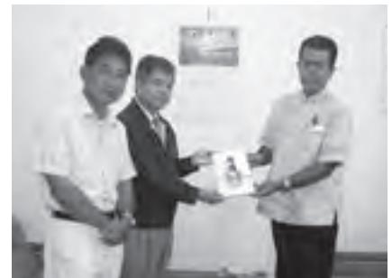
建築設計グループ八重瀬