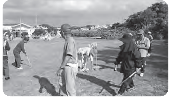
群星地区グランドゴルフ交流会でみんな仲良し 皆でつくった感慨深いグラウンドで汗流す幸せ！