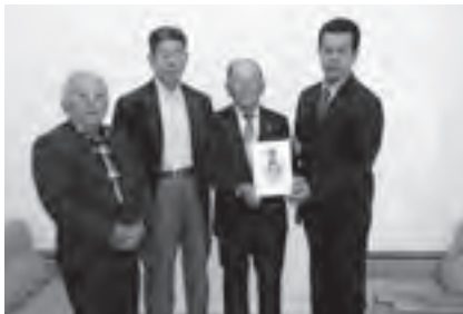
八重瀬町ゲートボール協会