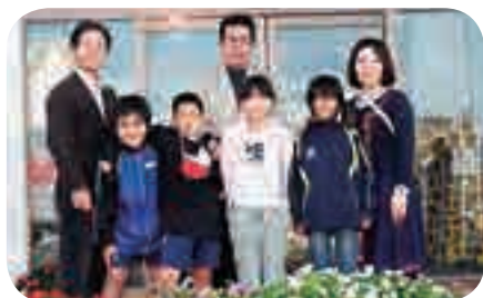
1月18日、新城小学校のインパチエンスの鉢植えの寄贈がありました