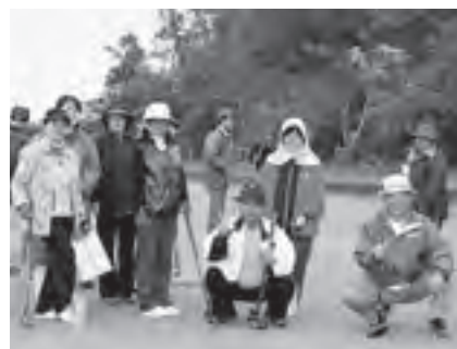
12/13 第1回チャリティグラウンドゴルフ大会（町GG協会主催）初めてのチャリティ協力