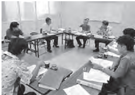
支援プロジェクト会議の様子

今回、意識調査を作成するにあたって、住民同士のつながりや住民がどのような形で活動しているのか等の実態を明らかにすることによって今後の地域福祉活動の発展、向上を目的としました。また、住民の参加を促進していくという意味では、今、住民の方々が地域活動や隣近所の関わりをどのような形でもっているのか等が把握できる内容となっています。