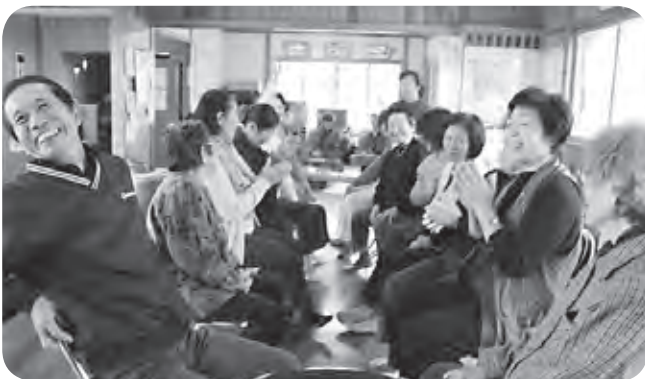
皆で初笑い！笑う門には・・・友寄東ハイツミニニデイ交流会