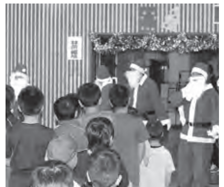
大切な親子の時間をともに楽しむ参加者の皆さん