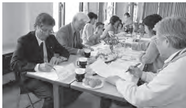
一番熱心な町長と社協会長！！