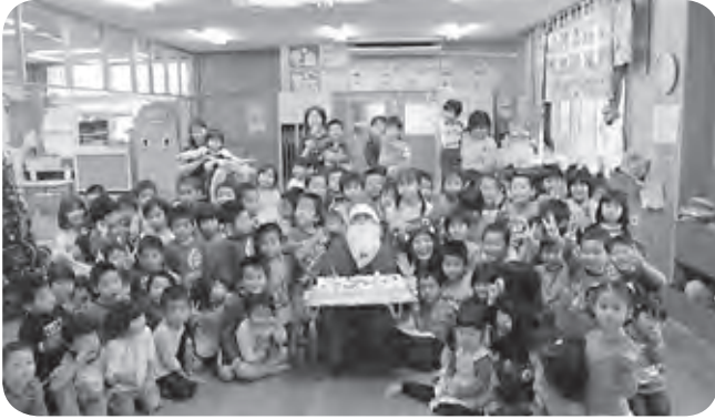
みどりが丘保育園にサンタが来たぞー！ 群星地区クリスマス子ども幸せ便