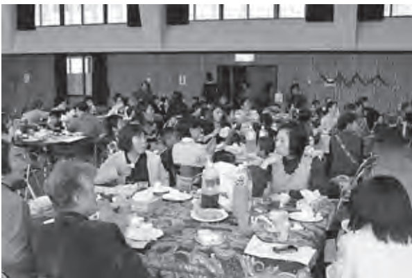
会場いっぱい、愛情いっぱい♡