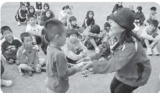
区長さん、ぼく、マラソン頑張ったよ！ 宇後原新春マラソン大会