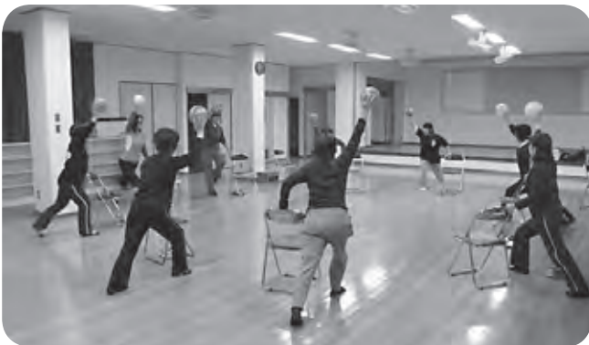
お母さんは一家の大黒柱？東風平婦人会健康づくり 昼間の仕事や家事を終え頑張る主婦の鏡！