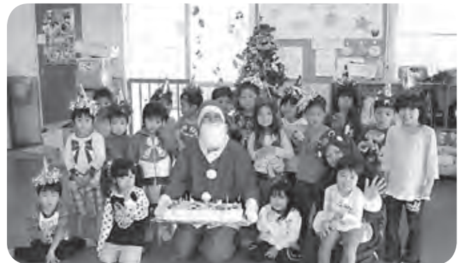
四つ葉地区こちの森保育園にもサンタさん登場！