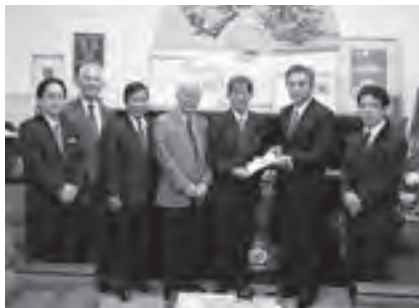
八重瀬町建設コンサルタント会