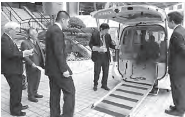
車両の後部からスロープが出て、車いすが2台入ります。