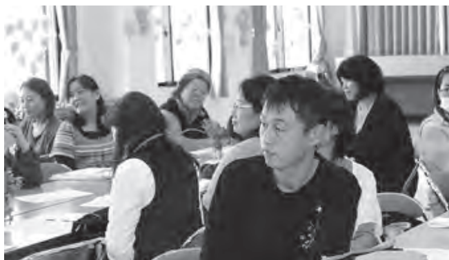
イケメンはイクメン？