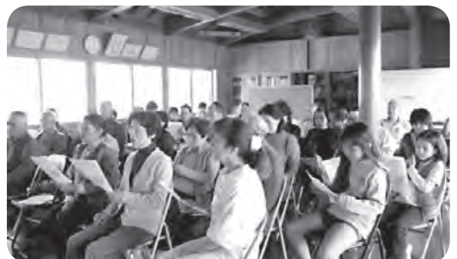
せまいながらも・・・群星地区ミニコンサート♪♪ 木づくりの会場（東ハイツ）はホットで最高！