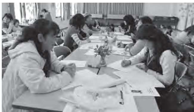
子育てを楽しまなくちゃ！