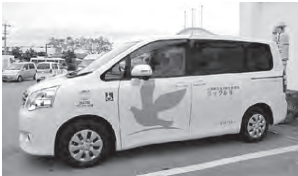
八重瀬町社協イメージキャラクターのクックルより、「クックル号」と名付けました。

平成24年1月5日に、沖縄テレビ放送株式会社玄関前にて、「第34回24時間福祉車両贈呈式」がありました。毎年、町内の小中学校の子どもたちが、街頭募金を実施していますが、なんとこの日、24時間テレビチャリティ委員会より贈呈団体の中から、県内では唯一八重瀬町社会福祉協議会へスロープ付き福祉車両が届けられました。