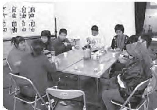
終了後は楽しい茶話会です