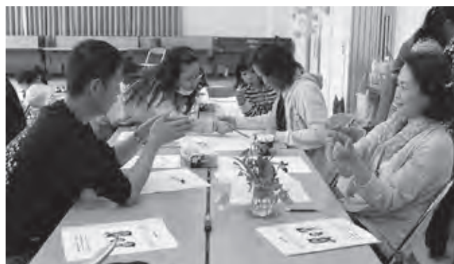
コミュニケーション力も大事ですね！