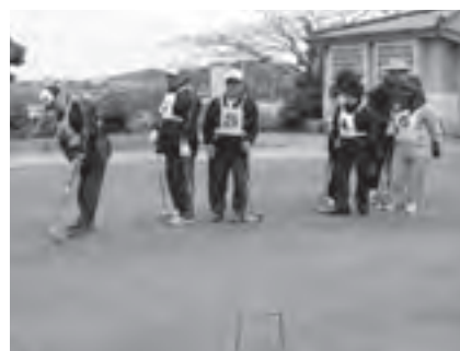
12/16 チャリティゲートボール大会（町GB協会主催）毎年恒例、赤い羽根募金にも協力