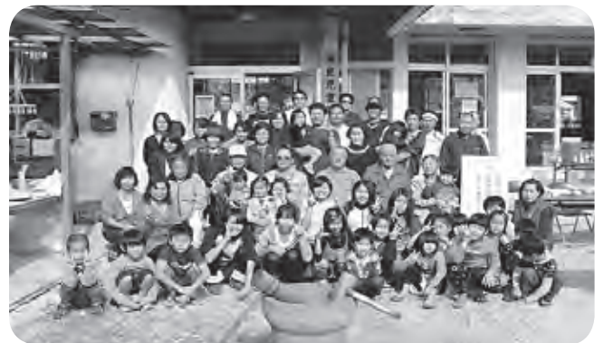
宇高良新春もちつき大会、みんなでもっちり！