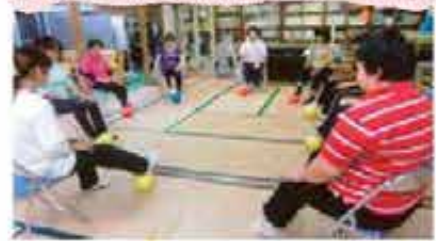
世名城 婦人会健康体操 (10/3~10/31)