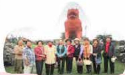
新城 ミニデイボランティア交流会 (11/15)