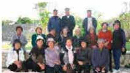
上田原かりゆし会ミニデイピクニック (12/19)