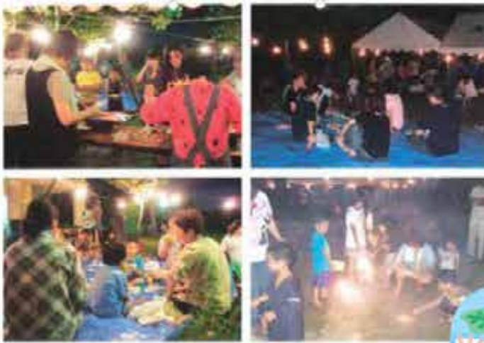
大頓団地夕涼み会 (7/31)