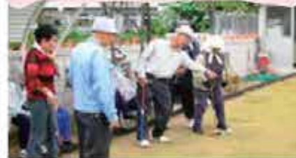
三字 (伊藤,上田原,屋直原) GB交流会 (11/23)