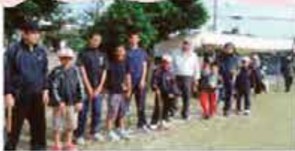
世名城 新春ゲートボール大会 (1/3)