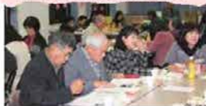
第2回志風地区推進会 (2/3)