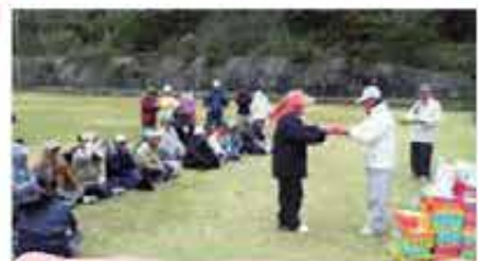
東風平長寿会新春GB/GG交流会 (1/3)