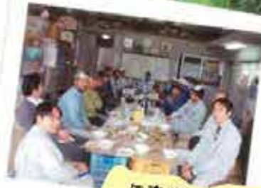
与座ゲートボール場清掃 (12/11)