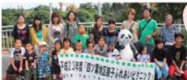
親子ふれあい ピクニック (10/23)