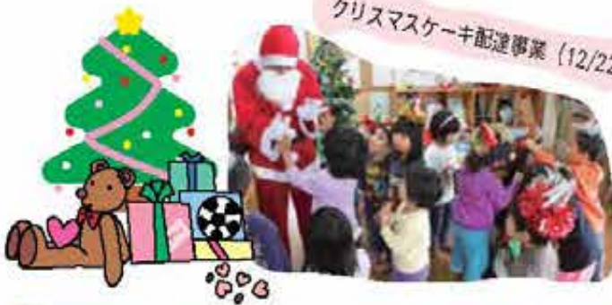
クリスマスケーキ配達事業 (12/22)