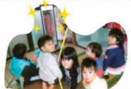
東風平保育園助成事業 (電気ストーブ購入)