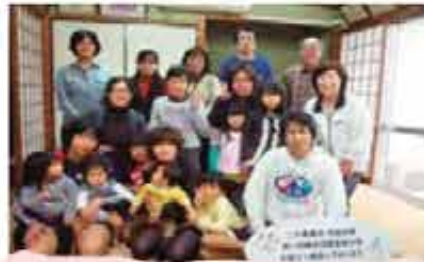
高盛 出産おめでとう (3/24)