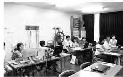
障がい者パソコン教室