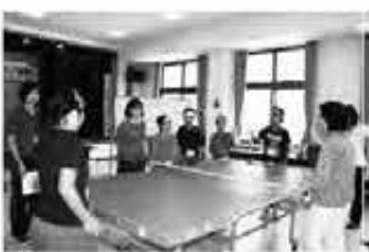
ボランティア講座