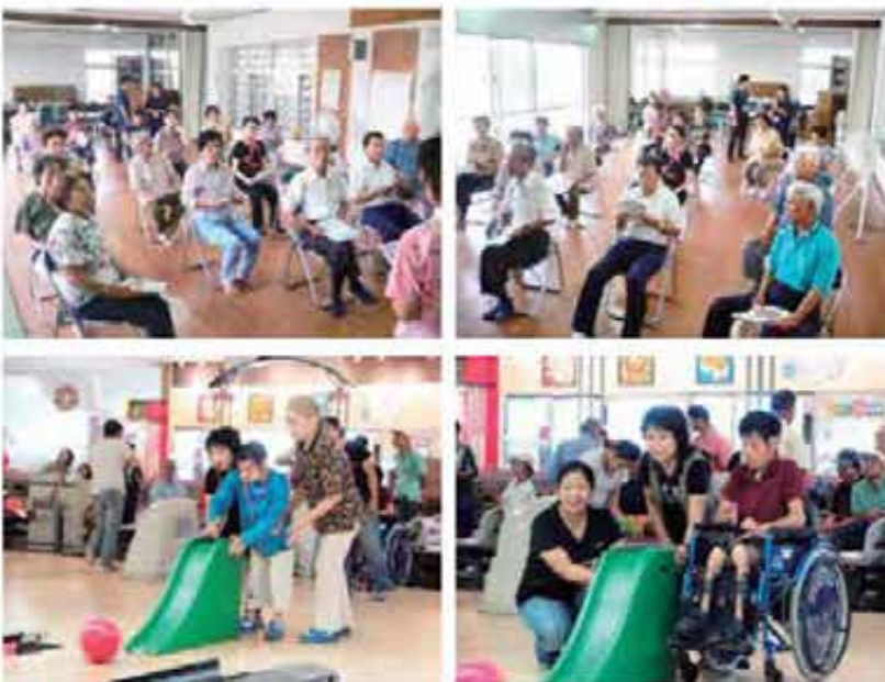
福祉作業所ボウリング交流会 (6/21)