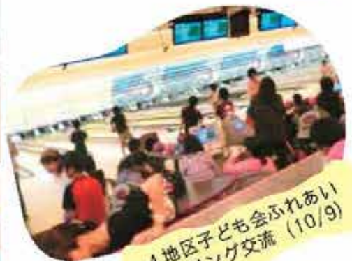
4地区子ども会ふれあいボウリング交流 (10/9)