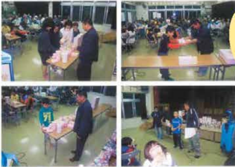
玻名城三代パークゴルフ大会 (1/3)