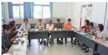
2回四ツ葉地区推進会 (2/29)