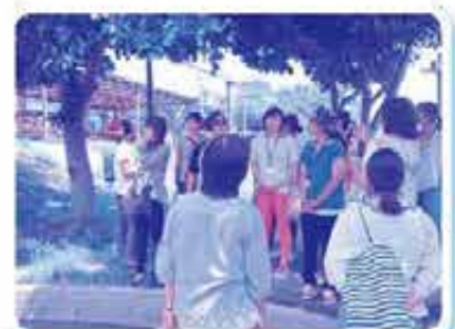
あおぞら保育園にて

内容の濃い講座で、 楽しく勉強することが できました。 講座があれば参加 したいです。