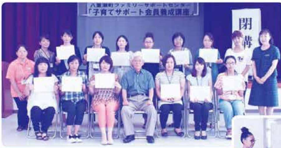
みなさん、お疲れ様でした。修了証をもってパチリ