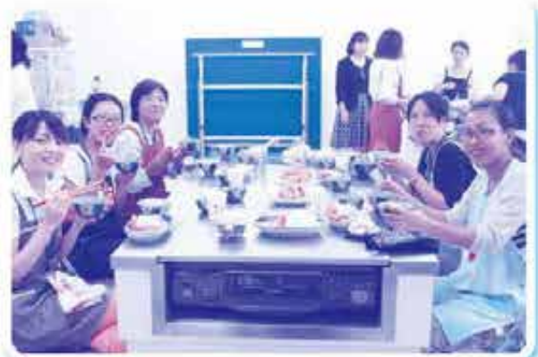
調理を終え、試食中です。美味しく仕上がりました。