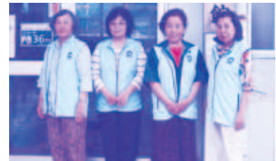
高良配食ボランティア