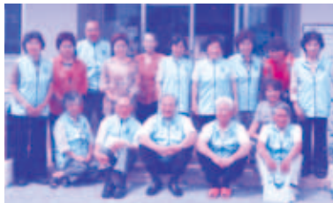
小城配食ボランティア