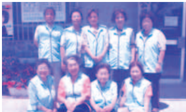
世名城 「ガジマル会」配食ボランティア