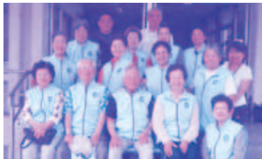
東風平配食ボランティア