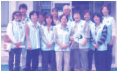
具志頭配食ボランティア