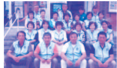
富盛 「睦美会」配食ボランティア