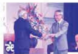
白ゆりの会(白川ハイツ)