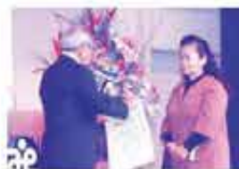
老人ホーム転生園