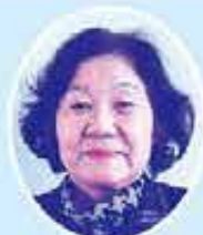
主任児童委員 (白川小学校区)