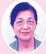
主任児童委員 (白川小学校区)