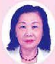
主任児童委員 (新城小学校区)