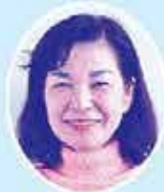
主任児童委員 (東原小学校区)