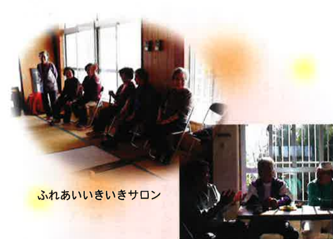
ふれあいいきいきサロン

《具志頭支所》〒901-0512 八重瀬町字具志頭645 TEL 098-998-4677 FAX 098-998-1948 E-mail gushikami-shisyo@image.ocn.ne.jp