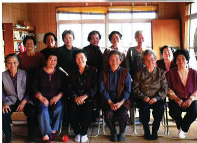
ミニデイサービス