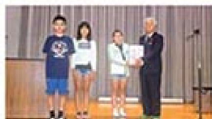
新城小学校贈呈式