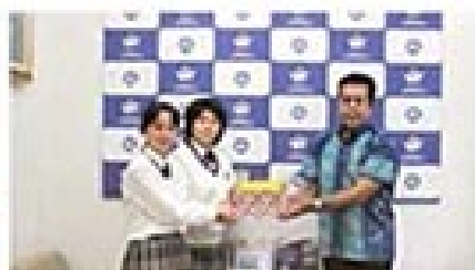
南部商業高等学校ボランティア贈呈式