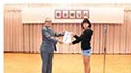
白川小学校贈呈式