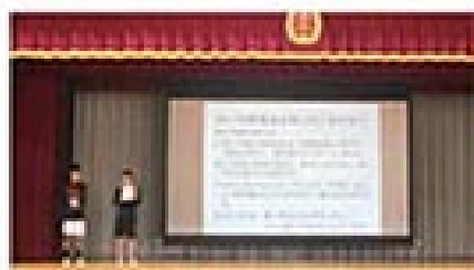
具志頭小学校贈呈式