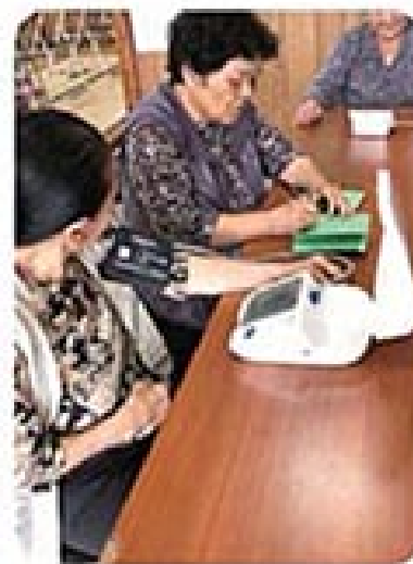
自主的に血圧測定