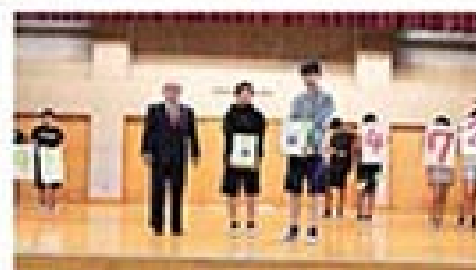
東風平小学校贈呈式