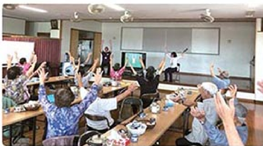
テレビを見ながらの健康体操

社協では、役場と連携を図りながらミニデイサービス事業の内容や活動方法を変更することにより、「健康寿命」の延伸（自助）や、地域の「支え合い」（互助）、人と人との繋がりをつくっていく支援など、将来を見越した事業展開を行ってまいります。