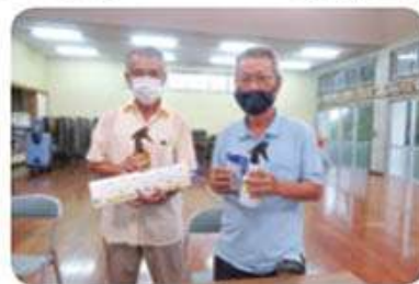
各支え合い委員会には本会よりコロナウイルス感染症の対策でアルコールや除菌シート、マスクを配布し安全・安心を心掛け運営できるよう支援しています。