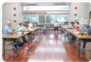
白川ハイツ自治会 支え合い委員会