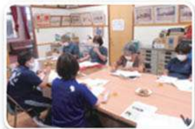
東風平区支え合い委員会