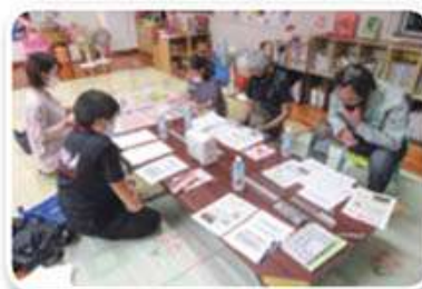
大頓区支え合い委員会