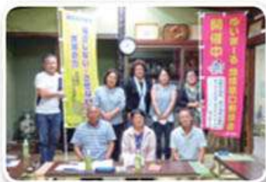
当銘区支え合い委員会