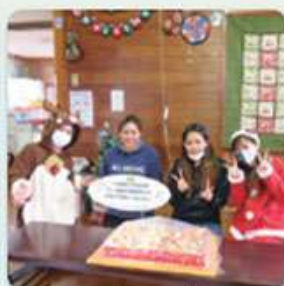
学童クラブわらびんちゃー 港川学童クラブ