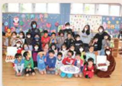
あらしろ児童クラブ