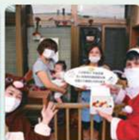
ひよこハウス乳児園