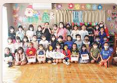
ぐしかみ学童クラブ