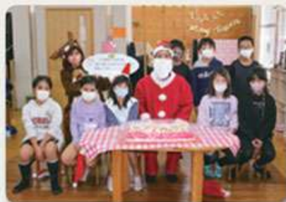
こちの森学童クラブ