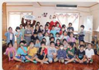
にこにこ児童クラブ