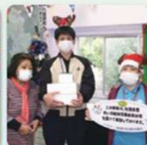
柿の木学童クラブ