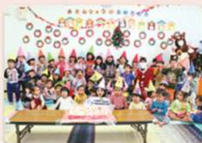
ななつぼし保育園