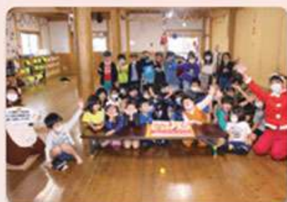
わらびんちゃー東風平クラブ・白川クラブ

去る12月22日(火)~28日(月)の7日間にかけて、町内の認可外保育園、学童クラブ等の13カ所にクリスマスケーキを配達しました。クリスマス交流会をより充実させ楽しく交流会を行ってもらう事を目的に実施しています。子ども達から「サンタさん、トナカイさんありがとう〜」や「また、来年も来てね〜」など嬉しい声をたくさん聞くことが出来ました。