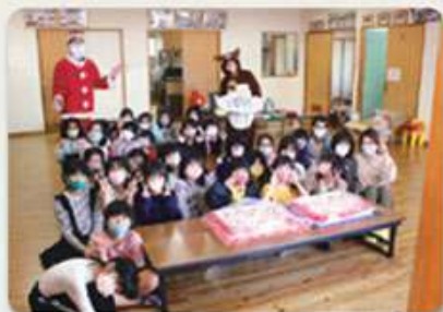
第1・第2はなぞの児童クラブ