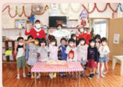
わかば児童クラブ