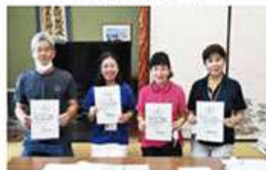
富盛支え合い委員会