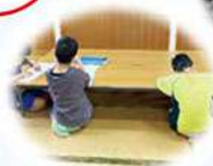
子どもの居場所づくり 運営事業