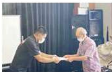
新城支え合い委員会