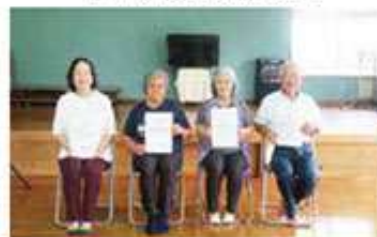
外間支え合い委員会