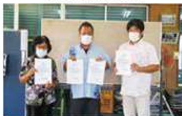
官次支え合い委員会