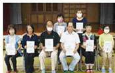
坂名城支え合い委員会