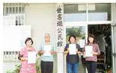
世名城支え合い委員会

今年度も新型コロナウイルス感染症の影響で活動に制限がありますが、感染症対策を行い引き続き各地区で支え合い委員会や地域窓口相談員研修会等を開催します。