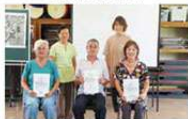
屋宜原団地支え合い委員会