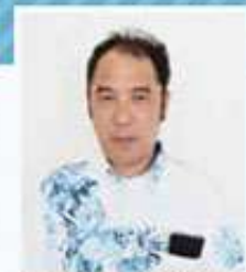
民生委員児童委員

ひとりで悩まず相談してください。民生委員児童委員には法による守秘義務があります。