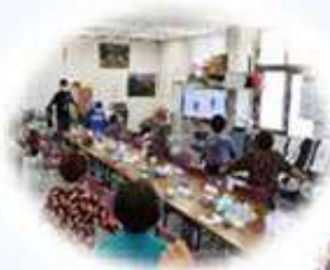
生きがい デイサービス事業