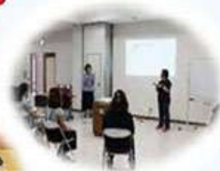
手話奉仕員養成講座

皆さまからご協力いただいた募金は、地域づくりのために有効に活用いたしました。各地域の活性化や、社会福祉に関する学習・研修活動を目的とした事業に助成し、地域福祉活動の推進を行っています。