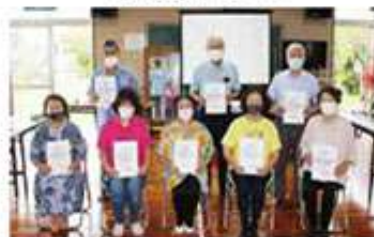
友寄第一団地支え合い委員会