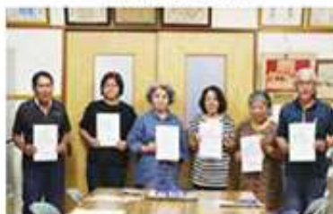
東風平支え合い委員会