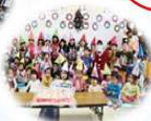
クリスマスケーキ配分事業