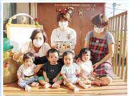
ひよこハウス乳児園