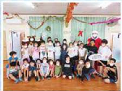
わかば児童クラブ