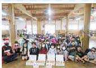
わらびんちゃー東風平クラブ・白川クラブ