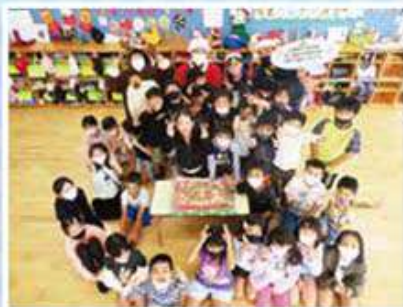
あらしろ児童クラブ