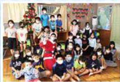
ぐしかみ学童クラブ