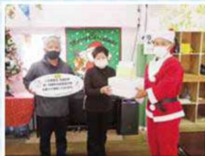
柿の木学童クラブ