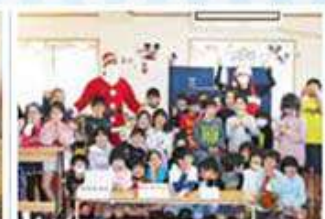
にこにこ児童クラブ