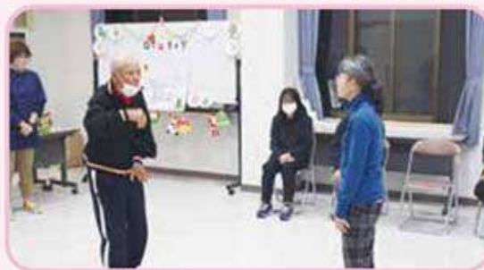
ジェスチャーゲームの様子