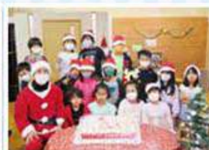
こちの森学童クラブ