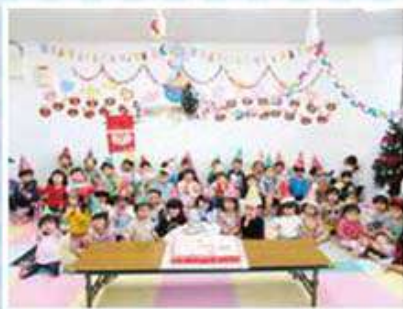
ななつぼし保育園