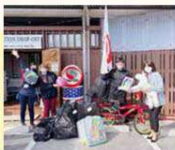
ヘルプオキ合同会社