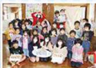
学童クラブわらびんちゃー港川学童クラブ