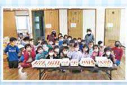
第1・第2はなぞの児童クラブ