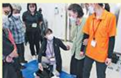
講師よりアドバイス(第2回)