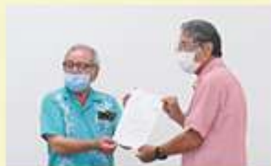
社協会長より諮問