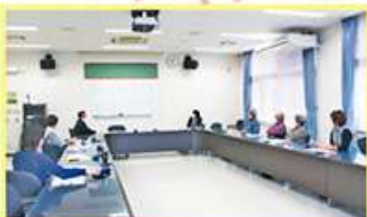
最終選考委員会の様子

12月15日(木)午後4時30分から社会福祉会館においてお披露目とキャラクター名の発表が行われました。