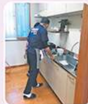
東風平支え合い委員会 (味噌汁会)