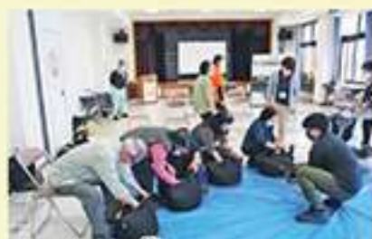
第2回 コンポストアフター講座(第2回)

本講座を通して参加者が環境やゴミ問題について考え、また楽しみながら身近でコンポストに取り組むきっかけに繋がることができたと思います。今後は、出来た堆肥で地域の農家とタイアップして農作物作りや花の寄せ鉢体験などを企画する予定です。