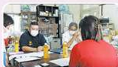
貝志頭自治会(情報共有・交換等)