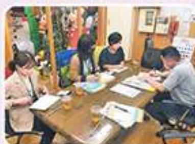
職場体験実習受入説明