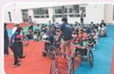
新城小学校 総合学習(福祉教育)