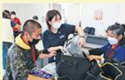
コンポスト作り(第1回)