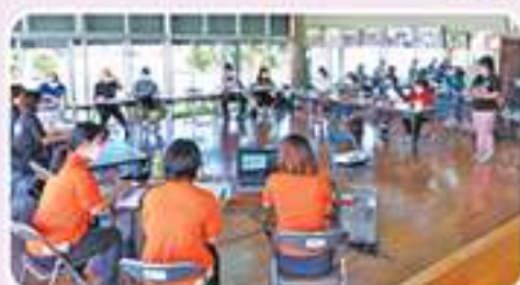
小地域活動連絡会(認知症講座)

今後も本連絡会では、地域と法人が連携し地域課題の解決に向けた取組みを行っていきます。