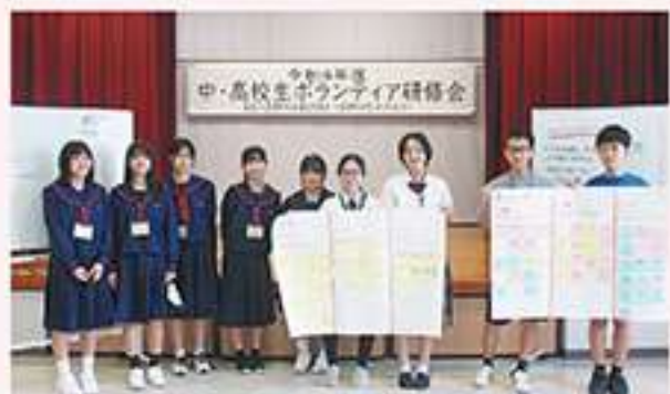
中・高校生ボランティア研修会