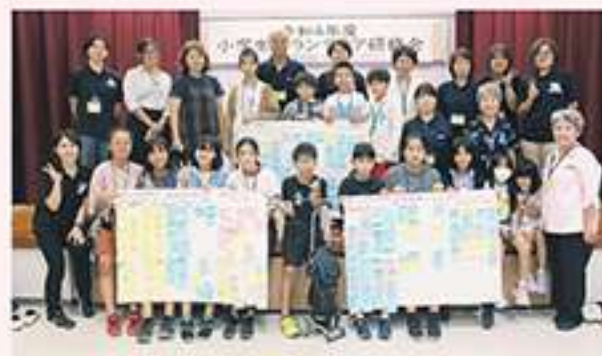
小学生ボランティア研修会

みなさんから頂いたご意見は、第3次八重瀬町地域福祉(活動)統合計画に反映させていきます。