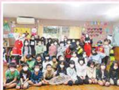
ぐしかみ学童クラブ