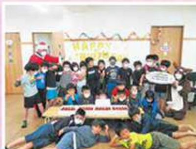
やぎばる第1・第2児童クラブ