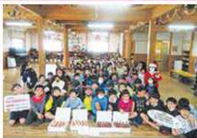
わらびんちゃー港川クラブ・ 白川・東風平クラブ