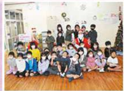
わかば児童クラブ