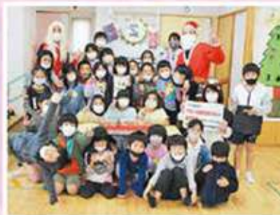
あらしろ児童クラブ