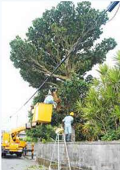
安里高齢者世帯の木の伐採