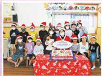
こちの森学童クラブ