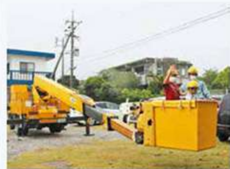
高所作業車試乗体験（港川保育園）