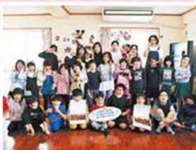
にこにこ児童クラブ