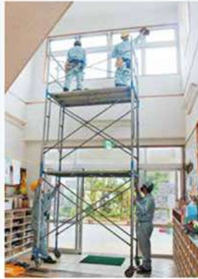
高窓清掃（港川保育園）