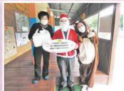
柿の木学童クラブ