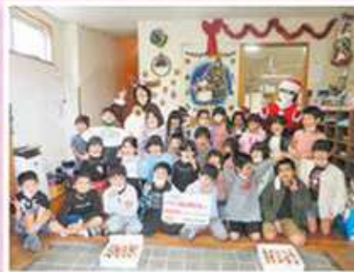
第一・第二はなぞの児童クラブ