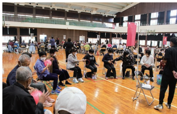
交流会の様子(リレー競技)