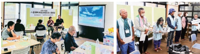
太希おきなわによる事例発表