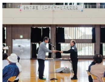
体力測定上位者表彰

参加者全員で赤組と白組に分かれ、リレー競技や借り物競争等を楽しみ最後には、やえせのシーちゃん社協キャラクターアイル君を交え、ちゃーがんじゅう体操を行い、介護予防に対する意欲向上及び参加者同士の親睦を深めることができ充実した交流会となりました。