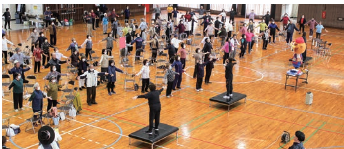
交流会の様子(ちゃーがんじゅう体操)