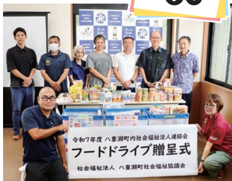
町内社会福祉法人連絡会 フードドライブ贈呈式

参加者からは「前年度に始めた取り組みを聞くことができた。続けることでつながりが生まれることを再確認することができた。」と感想をいただきました。