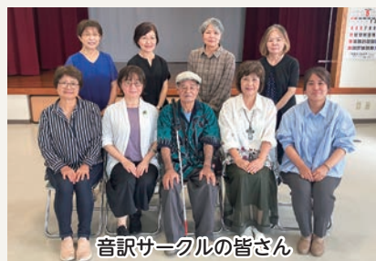
音訳サークルの皆さん