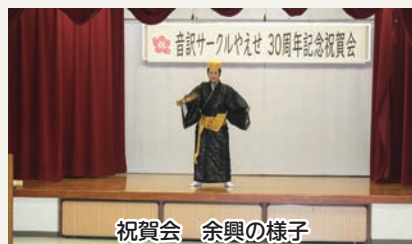
祝賀会 余興の様子