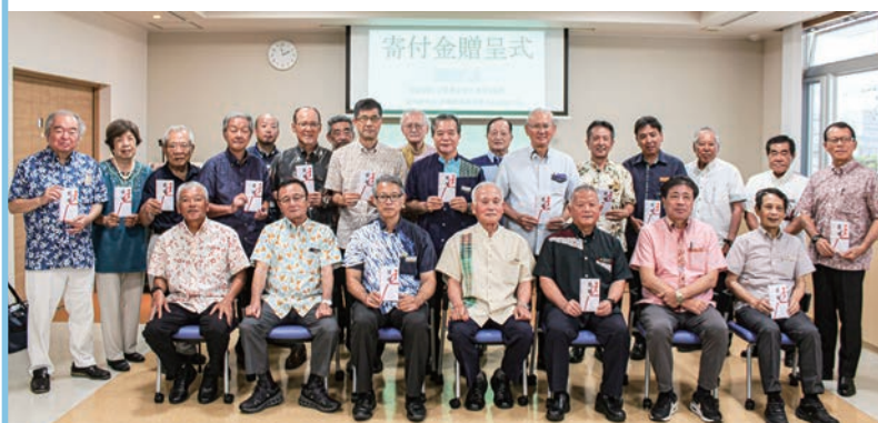
寄付金贈呈式会場での記念撮影