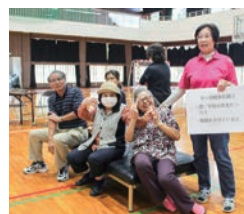
交流会の様子(借り物競争)