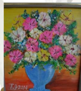
伊元武志さんの作品